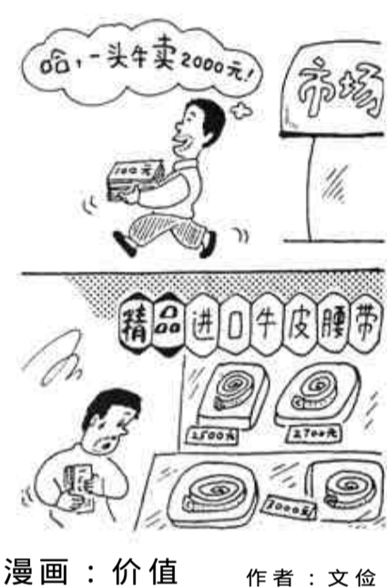
漫画：价值 作者：文俊